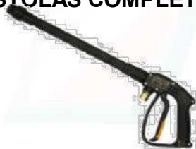
Mod. RL16 + PL4