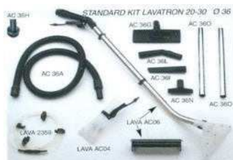
Mod. LAVA L20