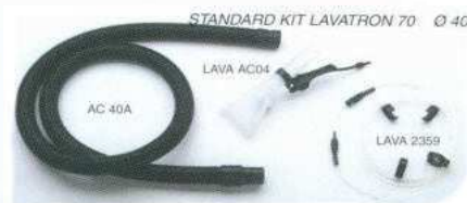
Mod. LAVA L70