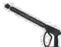
Mod. VEGA+S3 370