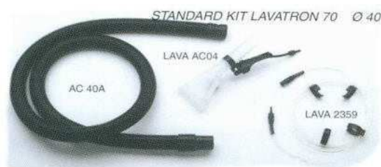
Kit Standard L70AB