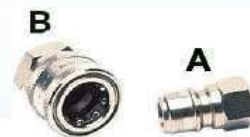
d. ARS220 / ARS