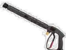
Mod. RL200 + S4