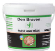
BOSTIK 4 Kg