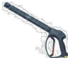
Mod. RL26 + S4