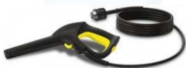
Kit (Mangueira+Pistola) QUICK CONNECT